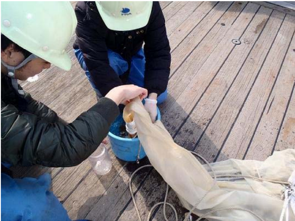
NORPAC ネットにより採集したサンプルの回収作業