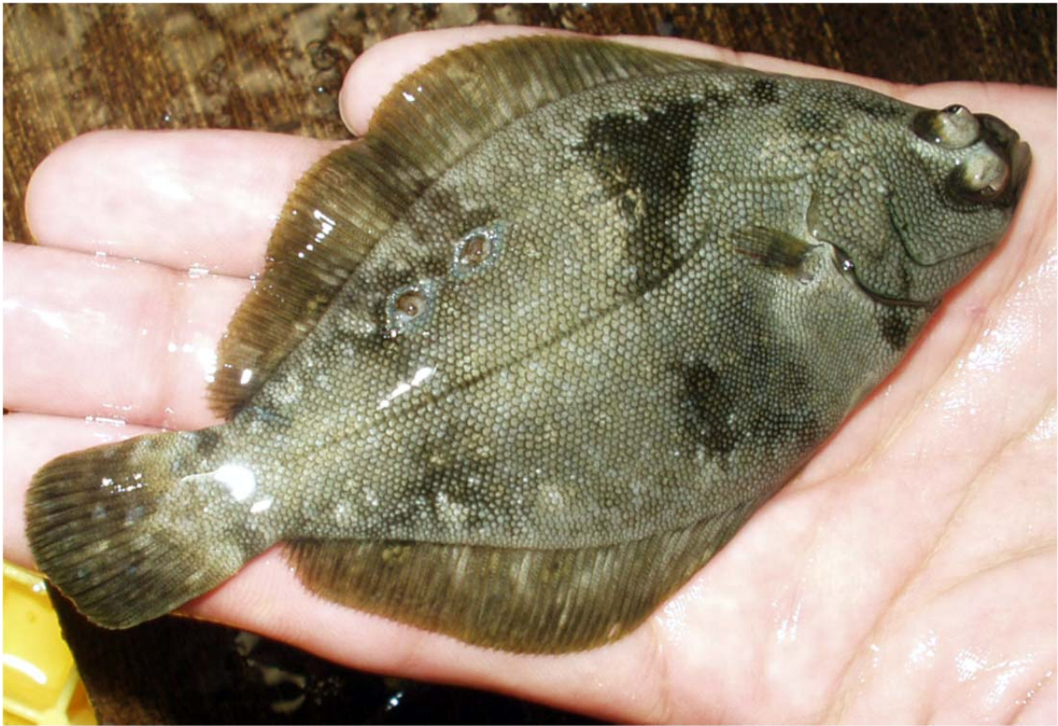
図1 パンチング標識を装着したホシガレイ稚魚