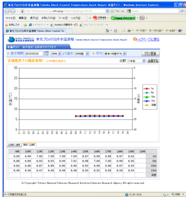
図2. 水温のグラフと値の例。