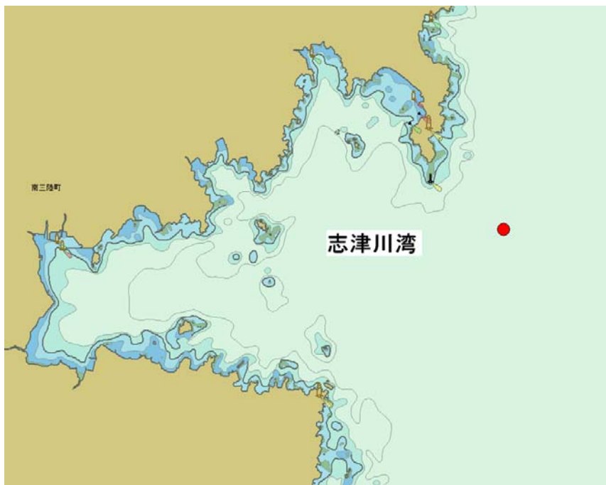
図 1. 赤丸の地点に海流・水温観測ブイを設置。