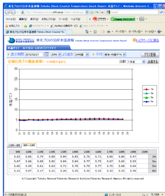
図 1. 水温のグラフと値の例。